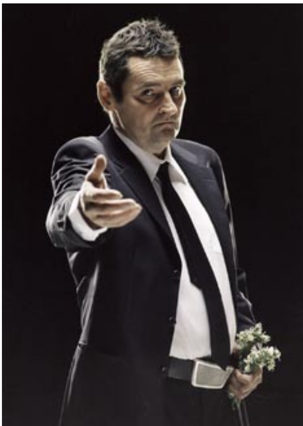
Blind Spot Oy on testannut Jadesoturin nettilevitystä.

Kalenterin 24. luokku oli sellainen, että sieltä sai Jadesoturin streamina koneelleen ja se oli siellä viikon ajan ilmaiseksi ladattavissa. Me halusimme testata, minkälainen kiinnostus ihmisillä on nähdä elokuva. Lopputulos oli, että seitsemän päivän aikana elokuva oli käynnistetty yli 100 000 kertaa, joka on jo hyvinkin merkittävä määrä. Varsinkin kun asiasta oli tiedotettu vain IRCin sisällä ja sielläkin vain tietyn palvelun käyttäjille. Kyllä elokuvan katseluun internetin kautta siis on valmiuksia ja tahtoa. Tietysti ilmainen on aina ilmaista, mutta jos jatkossa pääsisi samoihin lukuihin maksua vastaan, niin