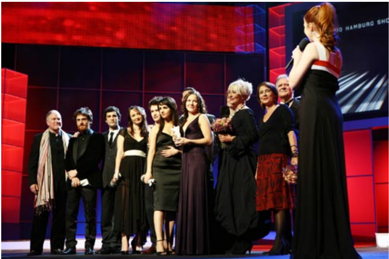
European Film Promotionin Shooting Stars -banke muutti muotoaan vuonna 2008. Jatkossa kaikki maat eivät osallistu bankkeeseen joka vuosi, vaan maita vaihdetaan vuosittain. Kuvassa tämänvuotiset Shooting Stars -näyttelijät Berliinin elokuvajuhlilla helmikuussa.

(Italialainen Media Salles -organisaatio julkaisee vuosittain European Cinema Yearbookin, jossa esitellään tilastot elokuvissakäynneistä Euroopassa. Vuoden 2007 Yearbook julkaistiin Berliinin elokuvajuhlilla 15.2.2008.)