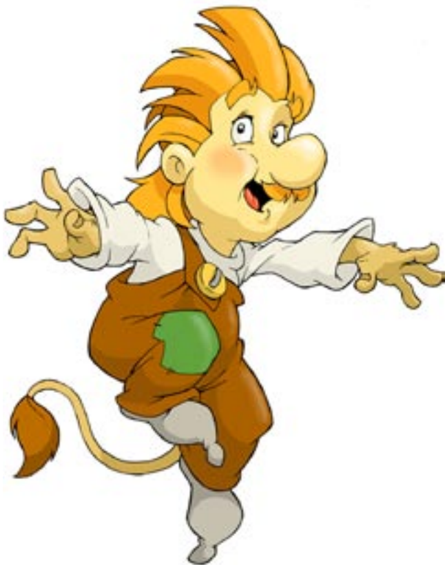
Röllin sydän -piirrosanimaatio valmistuu joulukuuksi 2007.

Kymmenen vuotta sitten ei vielä ollut olemassa käsitettä ”suomalainen animaatio-ala”. Nyt meillä on ala, joka puhalttaa yhteen hiileen ja tähtää kotimaan markkinoiden lisäksi vahvasti myös ulkomaille.