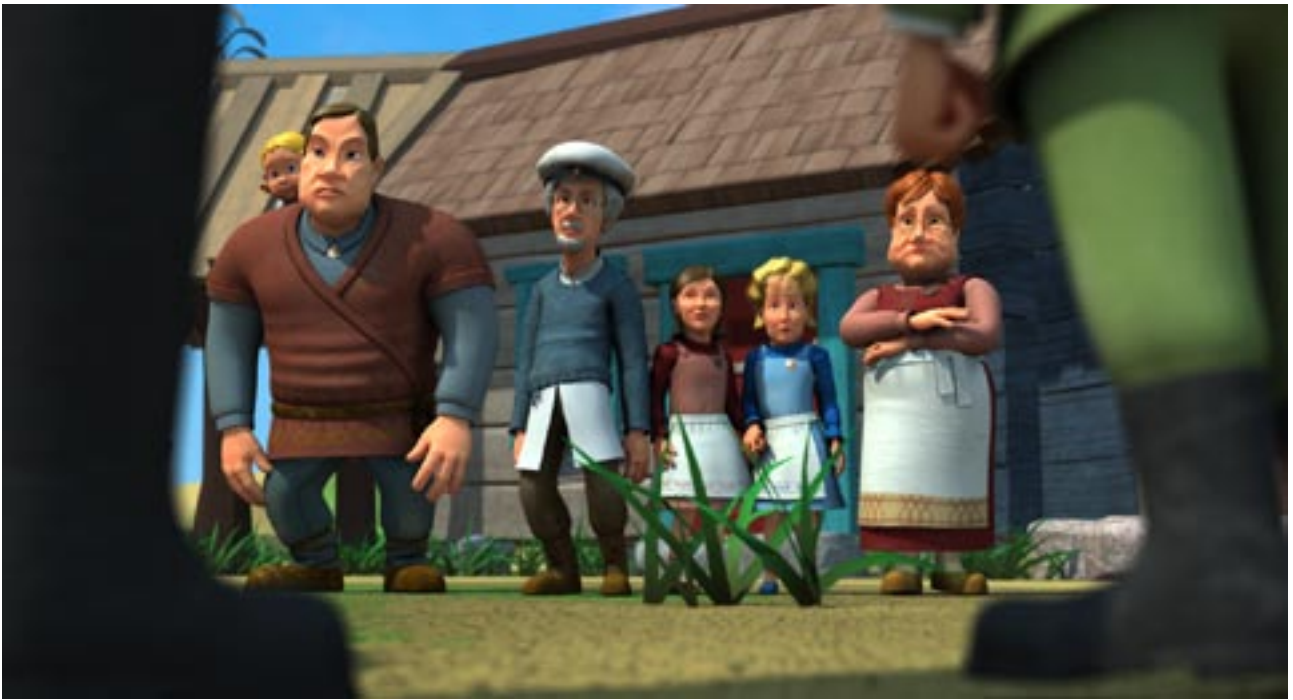
Keisarin salaisuus (tuotanto Helsinki -filmi Oy) on ensimmäinen kokopitkä suomalaisanimaatio sitten vuoden 1979.