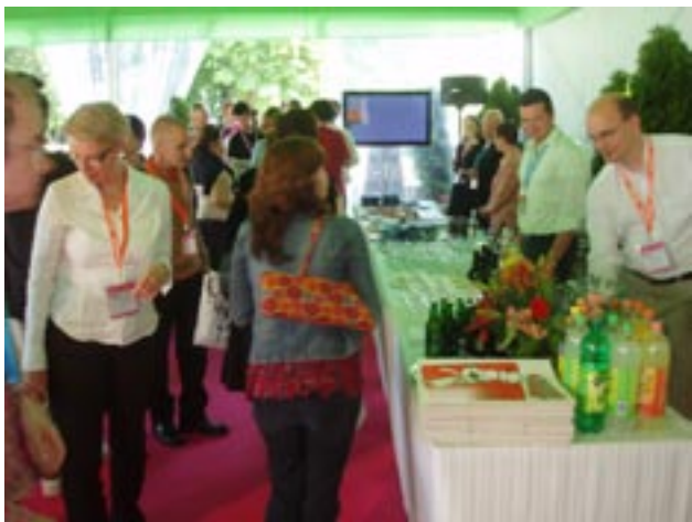
Finnanimation -vastaanotto keräsi hyvin väkeä