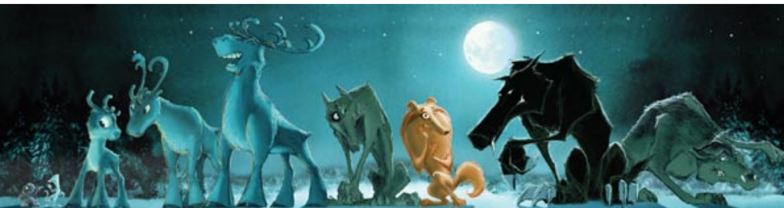
Lentäjän poika -elokuva saa ensi-iltansa joulukuussa 2007