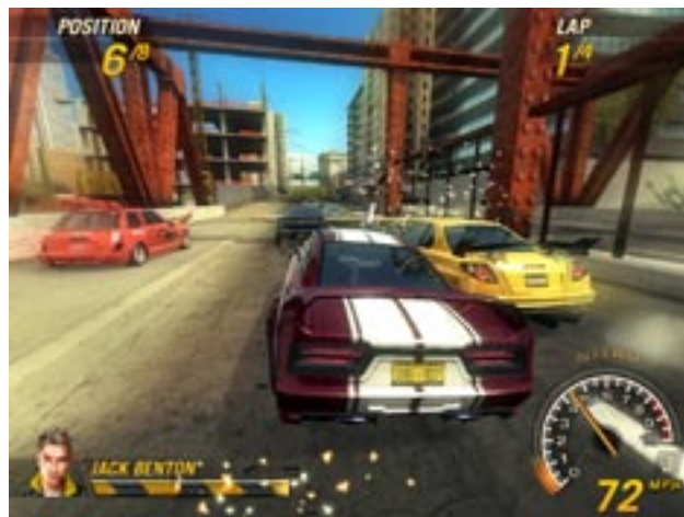
Bugbear Entertainmentille myönnettiin Slate funding -tuki vuonna 2006. FlatOut2 on yksi firman slatessa mukana olevista peleistä.