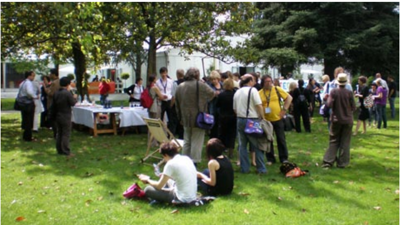
Finnanimationin piknik Ranskassa Annecyn MIEA-marketissa 12.6.2008.