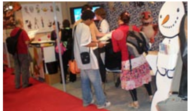
Finnanimation-standillä kesäkuun MIEA-marketissa riitti kävijöitä