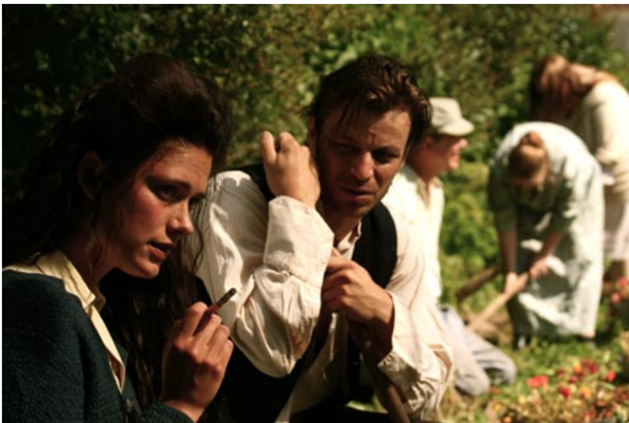
Krista Kosonen ja Peter Franzen Arto Halosen elokuvassa Prinsessa , joka on saanut Median bankekehittelytukea.