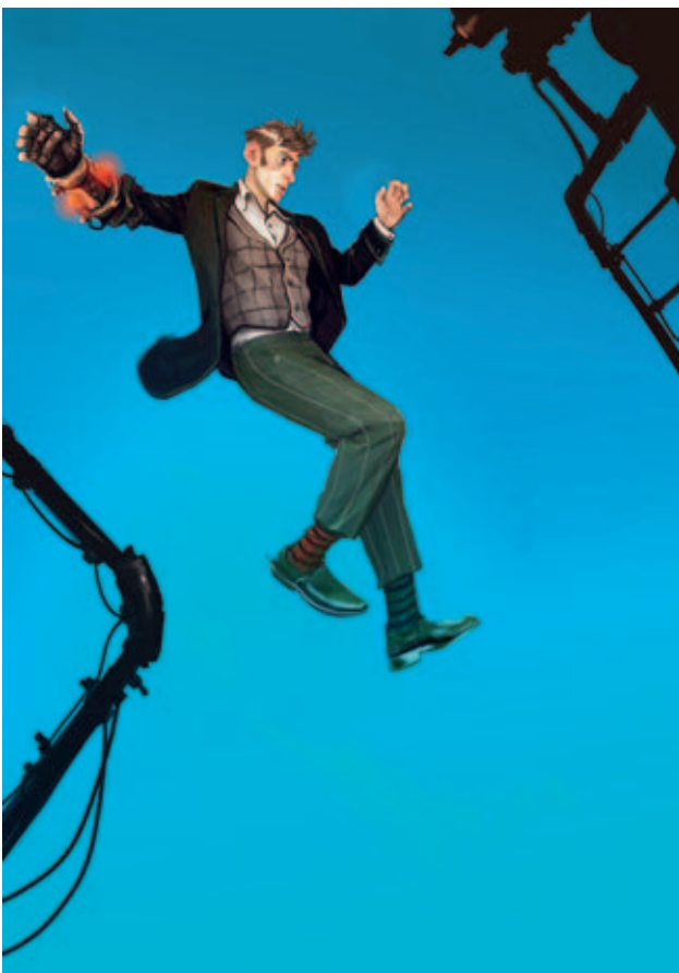
Recoil Games Oy sai interaktiivisten teosten bankekeittelytukea Aether -projektilleen. Yhtiö on saanut aiemmin samaista tukea myös Earth No More -projektille.