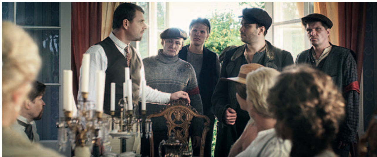
Missä kuljimme kerran

Kurssiohjelma: Koulutus koostuu kahdesta erillisestä work-